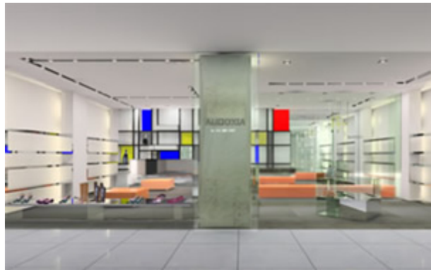
「AUDOXIA(アウドクシア)」のショップ環境イメージ