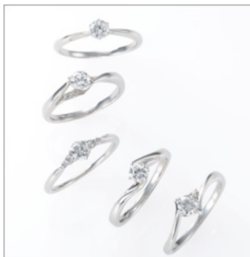
「Brilliant Love Promise(ブリリアント ラブ プロミス)」

両社は今後も、オンワードが求める“組曲ジュエリー”の洗練されたデザイン性と京セラが培ってきた技術と素材を融合した、新しい価値観を提案する商品開発に取り組んでいきます。