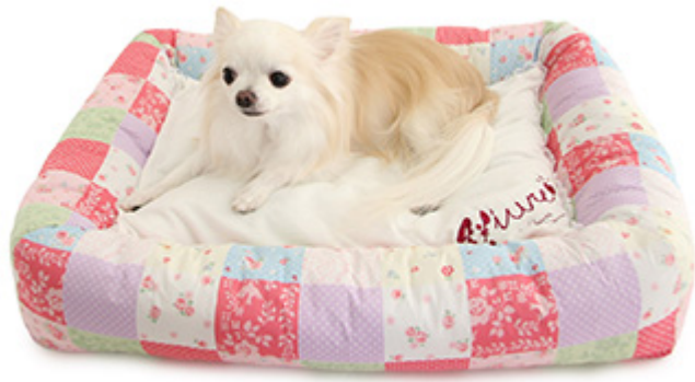
パッチワークカドラー S 6,800円、M 7,800円