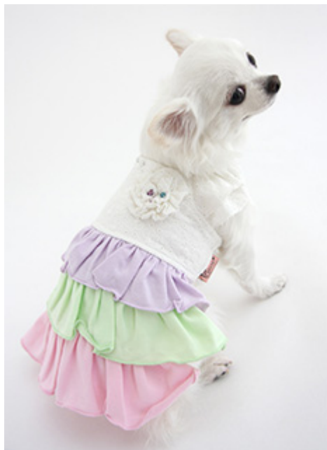
シャーベットワンピース 3,800円～