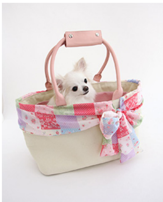
パッチワークキャリー S 9,800円、M 11,800円