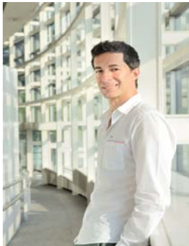
特別バレエレッスン講師 ジョゼ・マルティネス