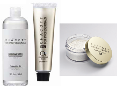
「チャコット フォープロフェッショナルズ」 スキンケアシリーズ