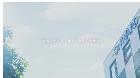
<パーパスムービー>

またパーパスの世界観を発信するパーパスムービーも制作いたしました。このムービーでは会社として行ってきたこれまでの取り組みと、これからの未来の社会に対する想いが込められています。このムービーを広く社会へ向けて発信すると同時に、従業員ともパーパスの共有をはかり、社員一丸となって取り組んでまいりたいと考えています。