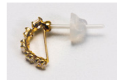
ポスト部にファインセラミックスを使用

ピアスのポスト部(軸)に、人工骨や人工関節などの医療材料としても用いられるファインセラミックスを使用しています。