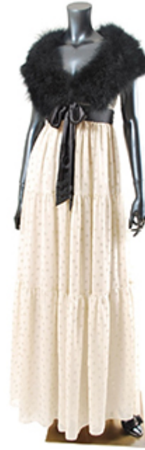
雪柄箔プリントドレス ¥55,650 フェザーケープ ¥19,950 ジュエルサンダル ¥29,400