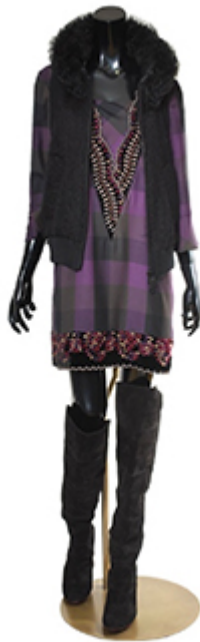
チェックテープワンピース ¥34,650 モヘヤ×ラムファーベスト ¥37,800 スエードニーハイブーツ ¥55,650