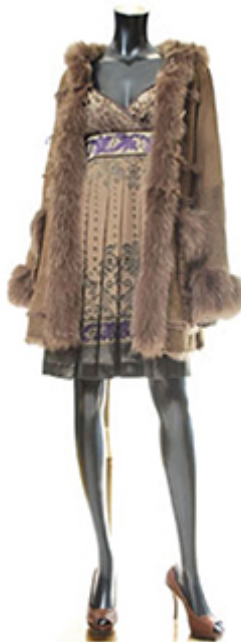
ファーダッフルコート ¥168,000 オパールプリントワンピース ¥29,400 タックレザーパンプス ¥29,400