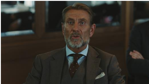
「ソノスーツ、ドコノ？」