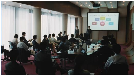
「ご質問ある方はどうぞ」