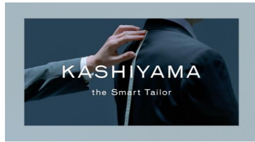
オーダーメイドスーツの KASHIYAMA