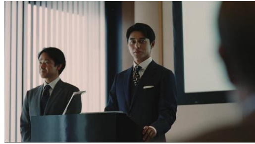
(と、思ったらうわ～。めっちゃ見てる)