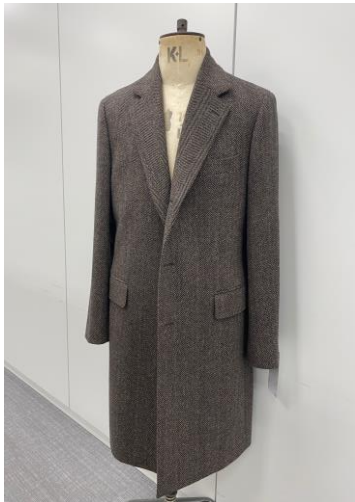
段返り 3 つボタン

□デザイン 3 型(段返り 3 つボタン、比翼 3 つボタン、ダブル 6 つボタン)