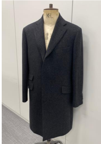
比翼 3 つボタン