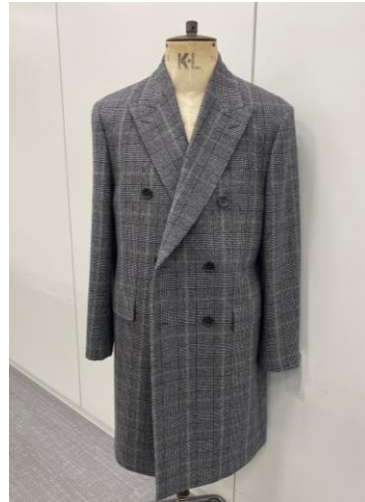
ダブル 6 つボタン