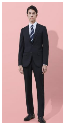
ブラック無地 2 釦スーツ