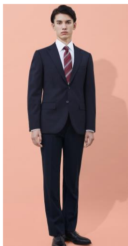
ネイビー無地 2 釦スーツ