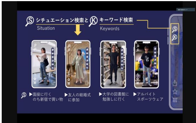
▲最優秀賞「東京8チーム」プレゼンの様子①