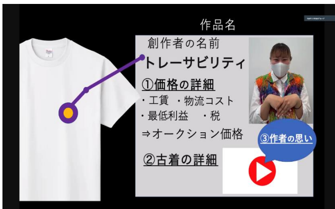
▲優秀賞「名古屋3チーム」プレゼンの様子①