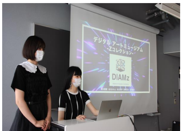
▲優秀賞「名古屋3チーム」プレゼンの様子②