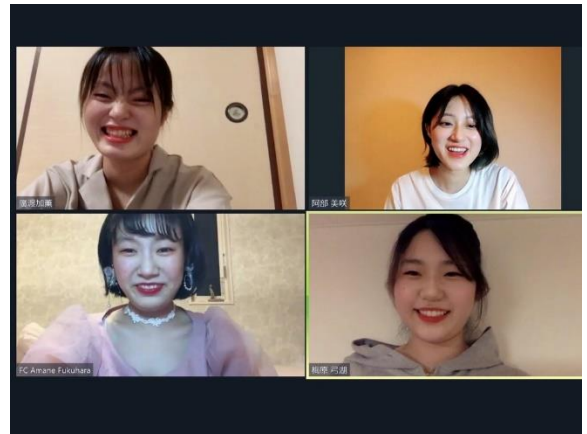
▲最優秀賞「東京8チーム」プレゼンの様子②