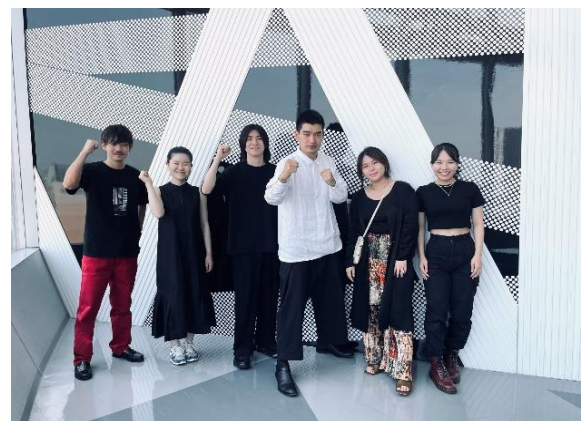
▲優秀賞「東京4チーム」集合写真