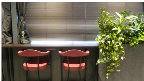
▲ 1人でも利用できるカウンスペース