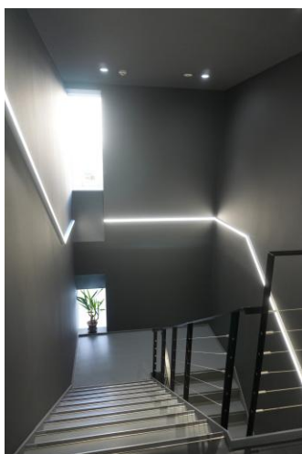
▲ 階段と廊下には直線状のライトを配置