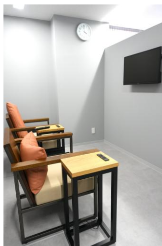
▲ 女性用待合室（左）と男性用待合室（右）