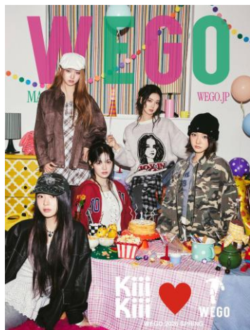
WEGO MAGAZINE【KiiiKiii 特別版】

数量限定のセットとなっておりますので、ぜひお見逃しのないよう、お近くの店舗にお立ち寄りください。