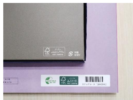
FSC 認証・ベジタブルインキマーク (化粧箱・冊子型カタログギフト)