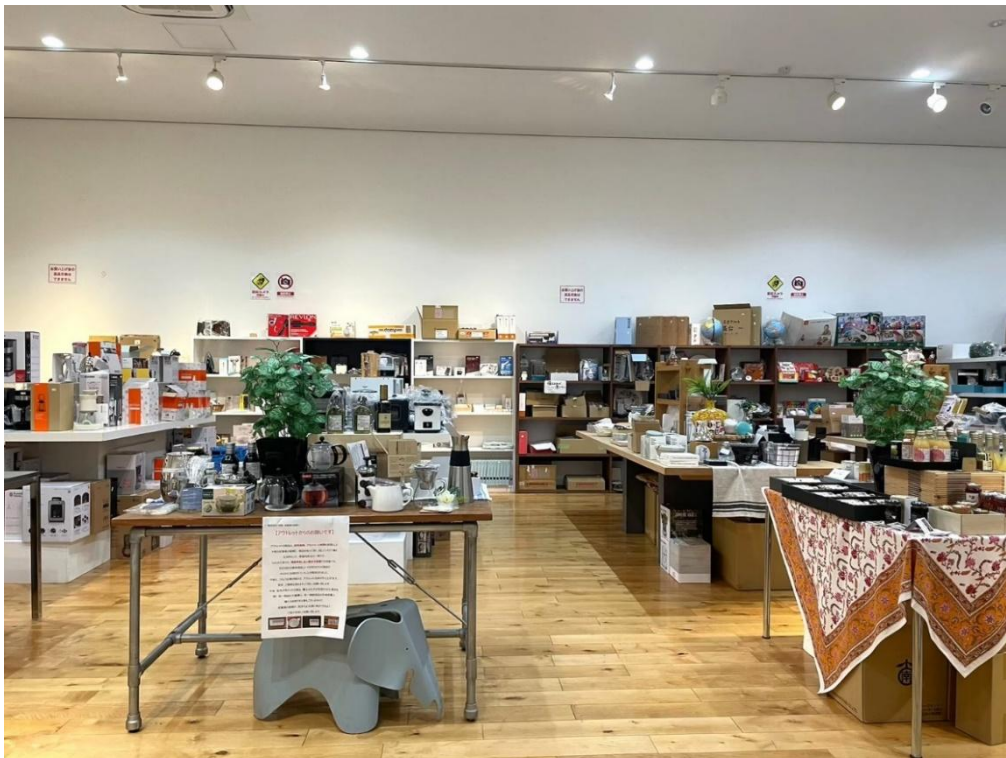
長野本社内 社員向けアウトレット店内の様子