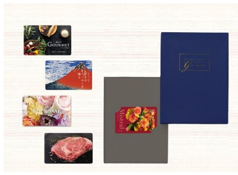
「カード型カタログギフト」