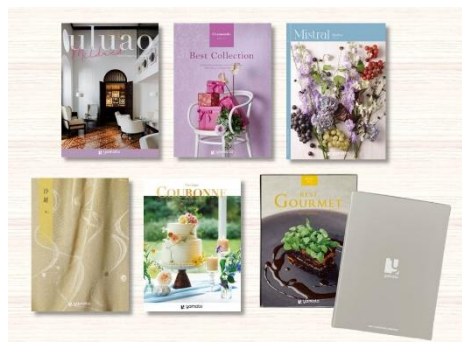
「冊子型カタログギフト」

※3 LIMEX：石灰石を主原料とし、紙やプラスチックの代替として活用される環境配慮型の新素材。