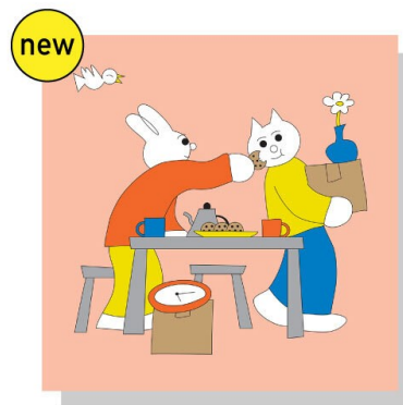
《#103 NEW LIFE GIFT!!!》 ビジュアルイラスト

今年も11月22日「いい夫婦の日」が近づくなか、新型コロナによる制限等は以前よりだいぶ緩和されつつも、未だ遠方の親戚や友人たちと会うことがためらわれる状況が続いています。