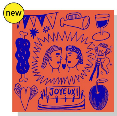
《#102 ハッピーウェディング！》 ビジュアルイラスト