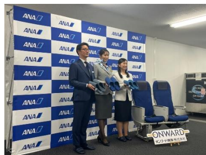
▲座席画像、会見の様子