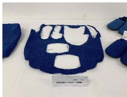
▲くり抜き前のシートカバー (左) と、くり抜き後のシートカバー (右)