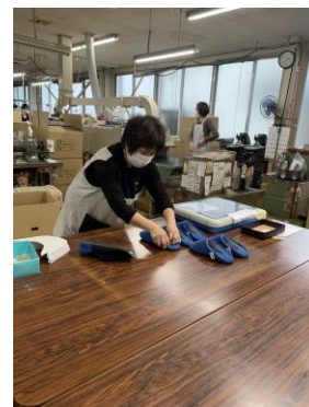
▲山形県河北町で一つひとつ手作りで生産されている様子