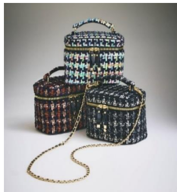
商品名:PILA vanity bag ツweed 価格:24,200円(税込) カラー:ブラック、レッド、ミックス