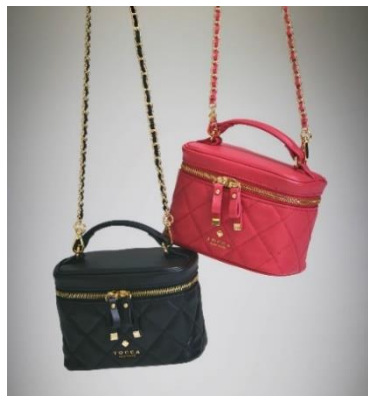
商品名:PILA vanity bag レザー 価格:24,200円(税込) カラー:ブラック、ピンク