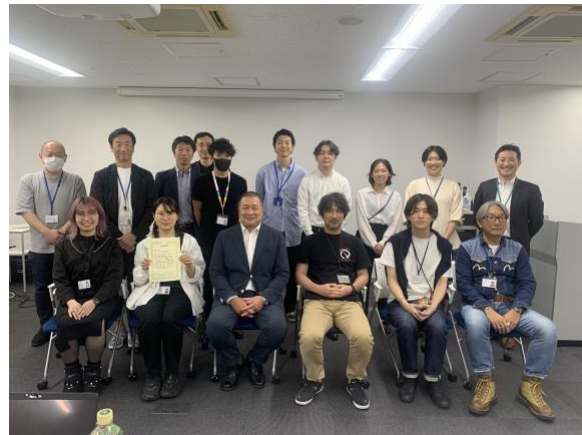
〈ワークショップ終了後、参加者による集合写真〉

成果発表会では、称賛アプリと社内の自動販売機の紐づけや、社内副業マッチングアプリ等のアイデアが出て、「テーマに合致しているか」、「新規性・独創性があるか」「社内へのインパクトがあるか」「実現性があるか」の4つの評価項目をもとに、社長、各グループ長、社外の専門家が評価を行いました。最優秀に選ばれたのは、若手社員間のスキルの差を課題と捉えて、性格診断を用いたマッチングシステムの導入を提案したチームで、他の案も含め、具現化に向けた検討が始まっています。