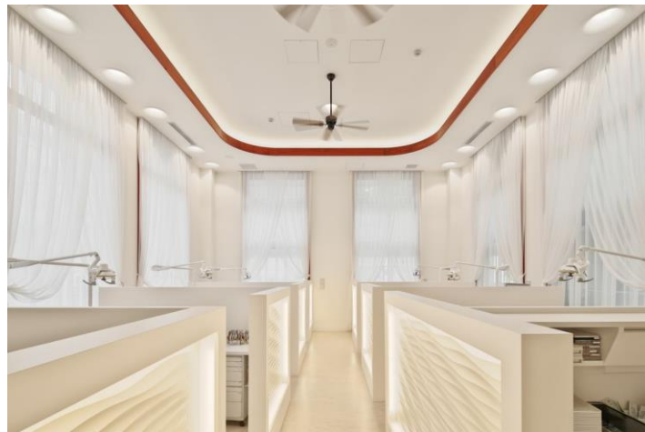
〈吉井矯正歯科クリニックの診察室〉

WELL 認証*…建物を空気の質や光、水質など複数の項目で評価し、建物の利用者の心身の健康に配慮されているかに焦点を当てた指標のこと