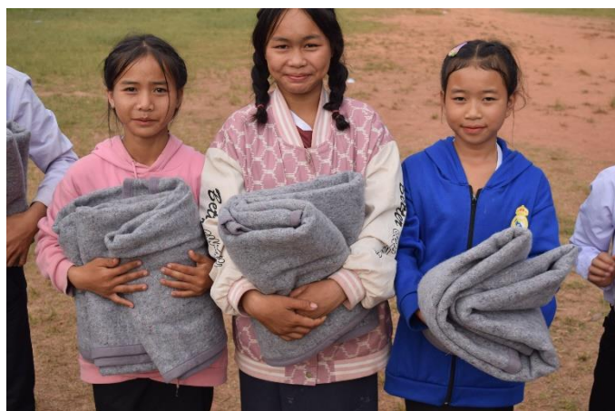
毛布を手にした子どもたち