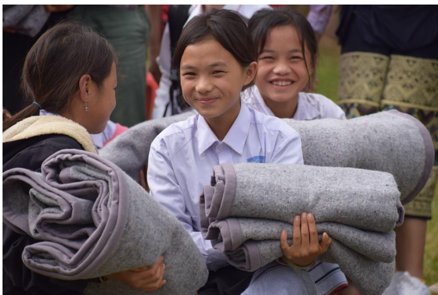
毛布を手にした子どもたち