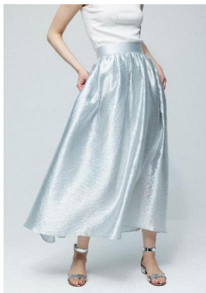
【シャイニーフレアースカート】