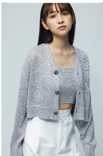
【ラメバルキーカーディガン】