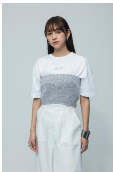
【ラメバルキーニットビスチェ】