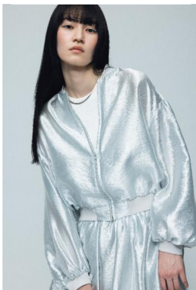
【シャイニーライトブルゾン】