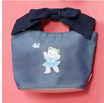
■familiar バッグ 19,800 円(税込)