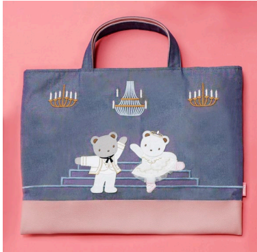
■familiar デニムバッグ 29,700 円(税込)

バレリーナを夢見て日々レッスンに励むクマちゃんが、憧れの『眠りの森の美女』を舞うオリジナルデザインで登場します。物語に登場するオーロラ姫とデジレ王子、フロリナ王女と青い鳥、宝石の精の衣装をまとったクマちゃんをあしらったデニムバッグをはじめ、大きなリボンがアクセントのバッグ、キュートなマスコットチャームなど全7アイテムを展開します。どこにでも持ち歩きたくなるような、心躍るデザインと上品さを兼ね備えた限定コレクションです。