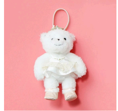
■familiar マスコットベアー 19,800 円(税込)