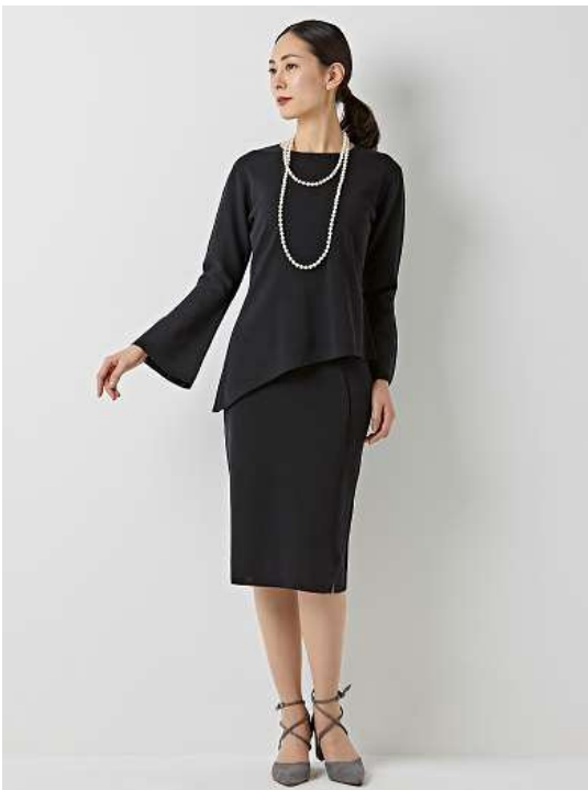
『JANE MORE』×『Kaoru Oshima』 ニットトップス (KRQMYM0377) ¥20,520 (税込) ニットスカート (KRQMYM0387) ¥18,360 (税込)