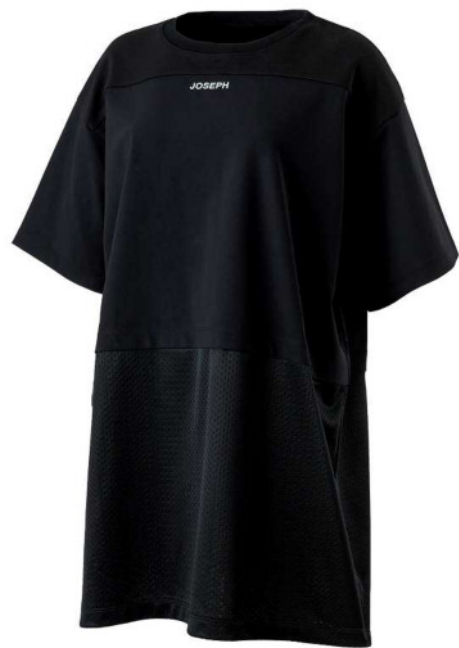
『JOSEPH HOMME』×『DRESSEDUNDRESSED』 カットソー (KHJDYM0334) ¥12,960 (税込)