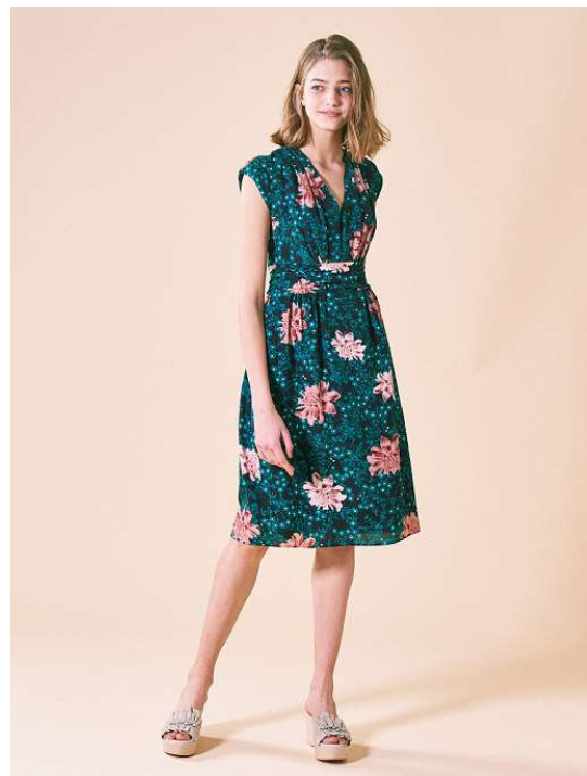
『TOCCA』×『ENLEE.』 ワンピース (OPTUYM0030) ¥31,320 (税込)