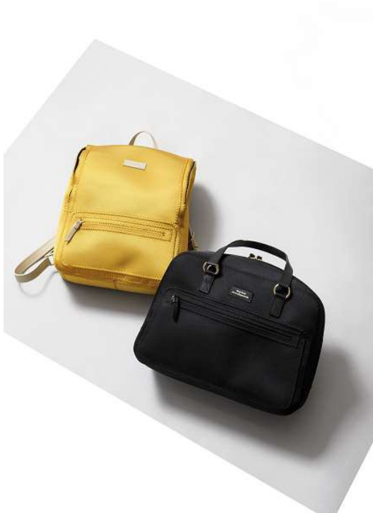
『23区 BAG』×『NAOTO SATOH』 バッグ (BOGKYM0370) ¥37,800 (税込) バッグ (BOGKYM0371) ¥41,040 (税込)