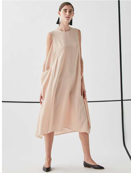
『BEIGE,』×『SUPPORT SURFACE』 ワンピース (OPCWYM0340) ¥46,440 (税込)