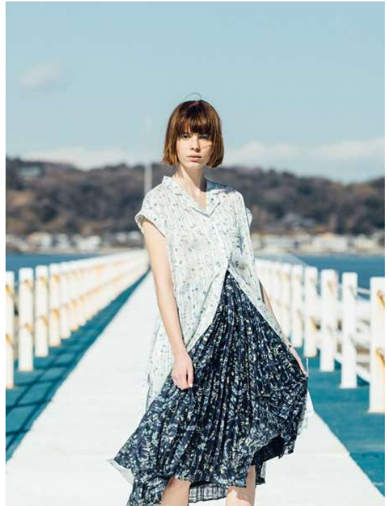
『組曲』×『JUN OKAMOTO』 ワンピース (OPWXYM0412) ¥28,080 (税込) スカート (SKWXYM0412) ¥25,920 (税込)