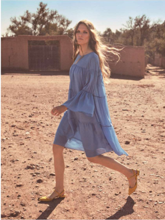
『23区』×『FLICKA』 ワンピース (OPBYYM0806) ¥42,120 (税込)