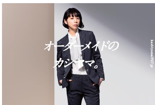
スーツ | 30,000円から | 最短1週間 KASHIYAMA

現在、メンズではスーツ以外に機能性に優れたカスタムメイド・セットアップの「MODERN TAILOR」をはじめ、フォーマルウェア、高品質な日本製のオーダーシャツを展開。エレガントなクラシックスーツを展開するウィメンズでは、ベースデザイン、素材、ヒールを組み合わせることで約30万通りの中からお好みの一足が選べるオーダーメイドウィメンズシューズを2019年11月よりスタート。取り扱いアイテムを拡大し、マス・カスタマイゼーション時代に対応する次世代の基幹事業へと成長を加速させています。