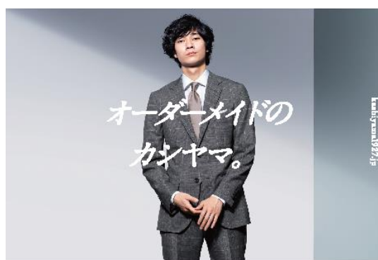
スーツ | 30,000円から | 最短1週間 KASHIYAMA

■『KASHIYAMA』公式ブランドサイト: https://kashiyama1927.jp/