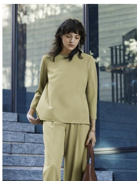
【Comfort】 程よいトレンド感と軽い着心地 を追求したライン