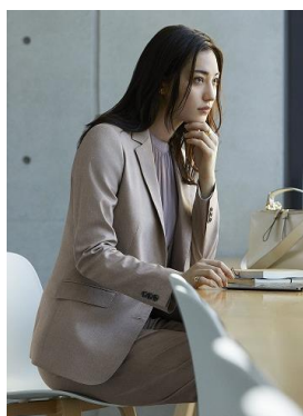
【NewBiz】 機能的できちんと感のあるライン