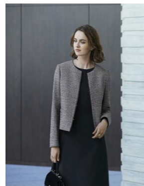
【Ceremony】 上質で程よいフォーマル感の あるライン