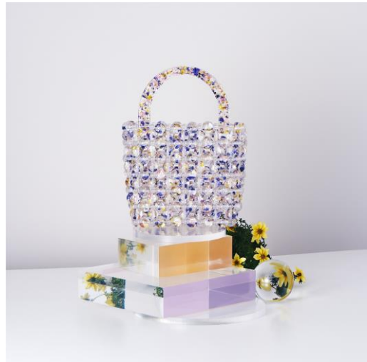
【DAHLIA】BEADS KNITTING BAG ¥165,000 (IN TAX)