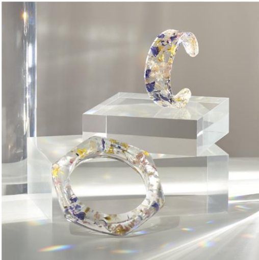
FLOWER HEXAGON BANGLE ¥7,700 (IN TAX) FLOWER C DOME BANGLE ¥3,300 (IN TAX)