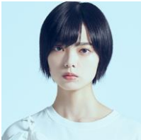
平手友梨奈 YURINA HIRATE

2001年生。2015年8月、櫛坂46の一期生オーディションに合格。2020年1月まで櫛坂46の中心メンバーとして活動した。2018年9月公開の映画『響 - HIBIKI-』では映画初出演にして初主演を果たし、「第42回日本アカデミー賞」で新人俳優賞、「第31回日刊スポーツ映画大賞・石原裕次郎賞」で新人賞、「第28回日本映画批評家大賞」で新人女優賞(小森和子賞)を受賞。2021年1月公開の映画『さんかく窓の外側は夜』、2021年6月公開の映画『ザ・ファブル第二章』に出演。2021年4月スタート TBS 日曜劇場『ドラゴン桜』へも出演が決定している。