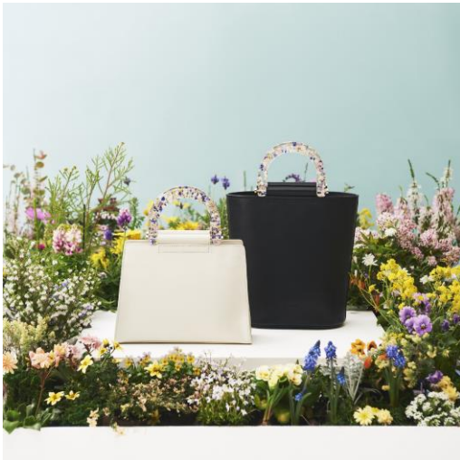
【LUPINUS】BUCKET BAG ¥49,500 (IN TAX) 【CATTLEYA】MINI HAND BAG ¥49,500 (IN TAX)