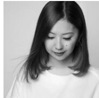
吉田ユニ YUNI YOSHIDA

「サカナクション」として、2007年にメジャーデビュー。文学的な言語感覚で表現される歌詞と、幅広い楽曲のアプローチは新作をリリースするたびに注目が集まり、第64回NHK紅白歌合戦に出場、第39回日本アカデミー賞にて最優秀音楽賞をロックバンド初受賞するなどその活動は高く評価されている。2019年6月には6年ぶりのオリジナルアルバム「834.194」をリリース。2021年8月にはバンド初のオンラインライブを実施し、2日間で6万人の視聴者を集め話題となった。2015年から音楽にまつわるカルチャーを巻き込み、クラブイベントやサウンドプロデュースなどを行うプロジェクト、NF(Night Fishing)を発起人としてスタートさせ、各界のクリエイターとコラボレーションを行いながら多様な活動も行なっている。