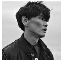
山口一郎 ICHIRO YAMAGUCHI

2001年生。2015年8月、櫛坂46の一期生オーディションに合格。2020年1月まで櫛坂46の中心メンバーとして活動した。2018年9月公開の映画『響 - HIBIKI-』では映画初出演にして初主演を果たし、「第42回日本アカデミー賞」で新人俳優賞、「第31回日刊スポーツ映画大賞・石原裕次郎賞」で新人賞、「第28回日本映画批評家大賞」で新人女優賞(小森和子賞)を受賞。2021年1月公開の映画『さんかく窓の外側は夜』、2021年6月公開の映画『ザ・ファブル第二章』に出演。2021年4月スタート TBS 日曜劇場『ドラゴン桜』へも出演が決定している。