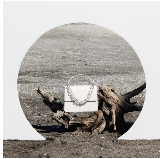
【CASABLANCA】 MINI FLAP SHOULDER BAG ¥49,500 (IN TAX)