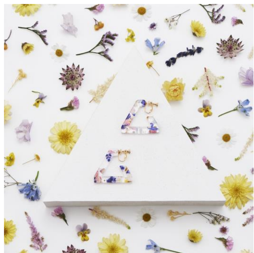
TRIANGLE HOOP PIERCINGS ¥4,400 (IN TAX) TRIANGLE HOOP EARRINGS ¥4,400 (IN TAX)