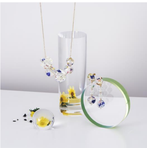
CUBE TOP NECKLACE ¥7,700 (IN TAX) BALL DROPPED PIERCINGS ¥6,600 (IN TAX) BALL DROPPED EARRINGS ¥6,600 (IN TAX)