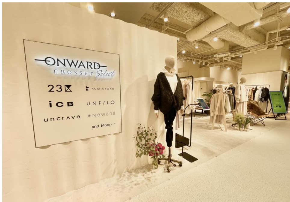
▲阪神梅田本店「ONWARD CROSSET SELECT」外観

OMO型店舗とは、2021年4月にスタートした実店舗とオンラインストアのメリットを融合した新業態で、ブランドの垣根を超えた売り場づくりと商品のみならずサービスも併設していることが特徴です。これまでに埼玉・愛知・千葉・高知の4店舗を展開していましたが、この秋の出店拡大により、全国13都府県、計14店舗にて展開します。今後、より多くのお客様に利用していただくことを目的に、さらなる出店拡大をまいります。